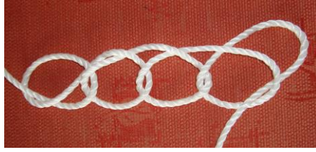
Μια αλυσίδα με λεπτό σκοινί