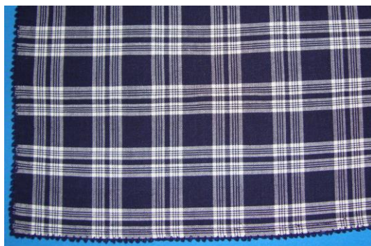
Τμήμα μισαλούδας με καρό υφαντό Εργόχειρο Αθανασίας Παρπανέλα, Νικόκλεια

γούδης, που είχαν μήκος 30-40 πόντους, οι οποίες έπαιρναν 15 καλάμια με τις κλωστές για το στημόνι. Έτσι τραβούσαν συγχρόνως 15 κλωστές, μ' άλλα λόγια με 20 δρομολόγια πήγαινε-έλα, αντί για 300, τέλειωνε το άπλωμα της κλωστής για το στημόνι με τις 600 κλωστές. Θα μπορούσαν να βάλουν πιο πολλά καλάμια, π.χ. 30 αντί 15, τότε όμως το τράβηγμα γινόταν βαρύ και κόβονταν οι κλωστές. Μόνο σε ειδικές περιπτώσεις, για παράδειγμα όταν ήθελαν να κάνουν ένα καρό υφαντό, που θα είχε και διαφορετικές κλωστές στημονιού σε χρώμα ή σε υφή, έβαζαν τα καλάμια με τις διαφορετικές κλωστές στη σειρά και έβαζαν όσα τους χρειάζονταν για να γίνει το καρό. Ένας συνηθισμένος αριθμός ήταν τα 20 καλάμια.