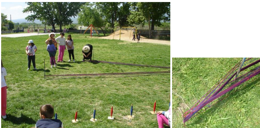
Αριστερά το ιδιάσμα , για την επαναλειτουργία του αργαλειού στο Δημητρίτσι και δεξιά λεπτομέρεια για το σταύρωμα Φωτογραφίες του Ζαφείρη Ζαπρούδη

κεφαλή(ι) έστηναν δυο πασσάλους (Α, Β) κοντά-κοντά, για να γίνεται εκεί μια διευθέτηση του στημονιού, όταν η ιδιάστρα γύριζε τις κλωστές από το κεφαλάρι για τη νουρά : έκαναν το σταύρωμα .